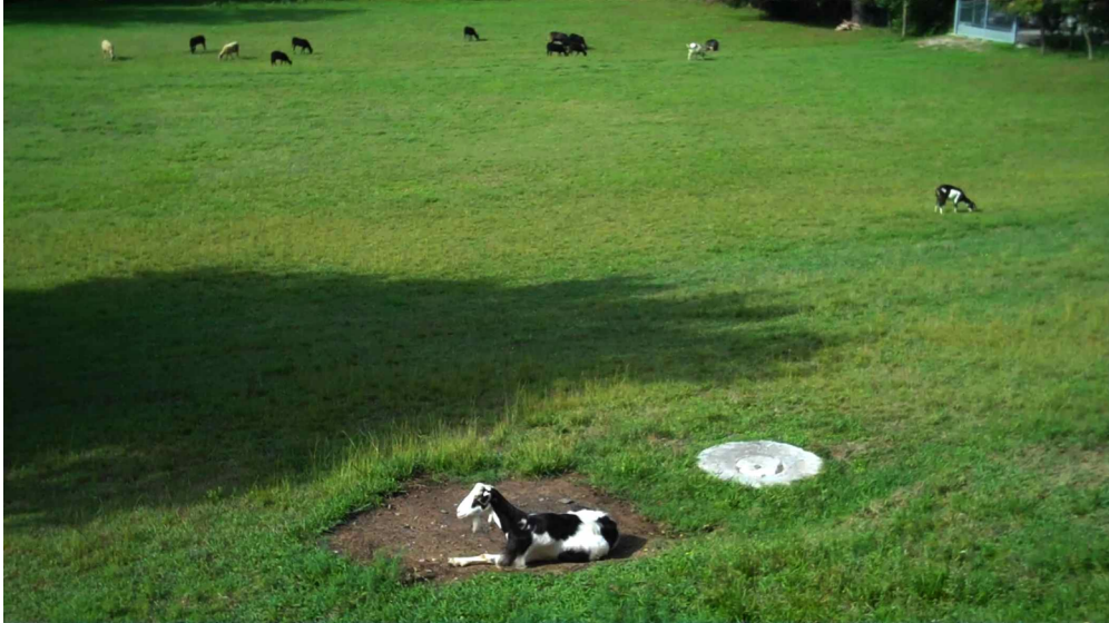
Filmstill aus Romuald Karmakars Beitrag »Elliott Waves« download filmstill: http://dl.dropbox.com/u/5888368/AADEI-Master-Foto.tif.zip